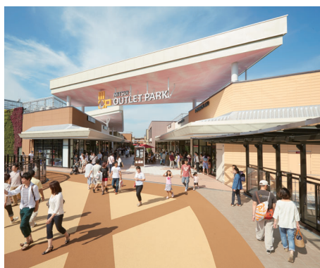
三井アウトレットパーク滋賀竜王 滋賀県蒲生郡竜王町