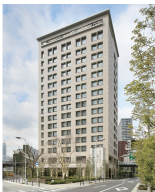
三井ガーデンホテル大阪プレミアム 大阪府大阪市北区