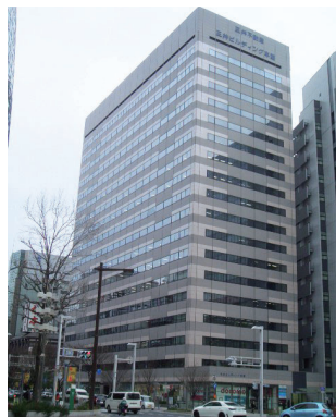
名古屋三井ビルディング本館 愛知県名古屋市中村区