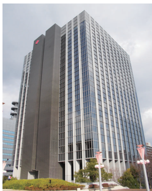
住友生命 OBP 城見ビル 大阪府大阪市中央区