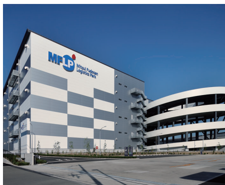
三井不動産ロジスティクスパーク堺 大阪府堺市堺区