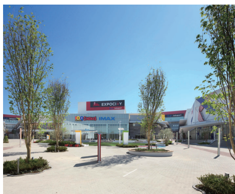
三井ショッピングパークららぽーと EXPOCITY 大阪府吹田市