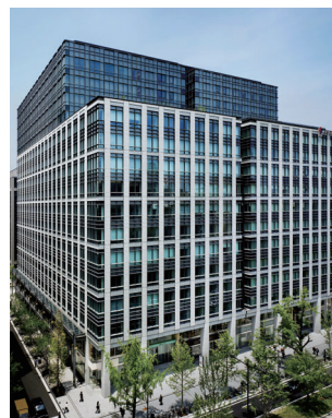
淀屋橋三井ビルディング 大阪府大阪市中央区