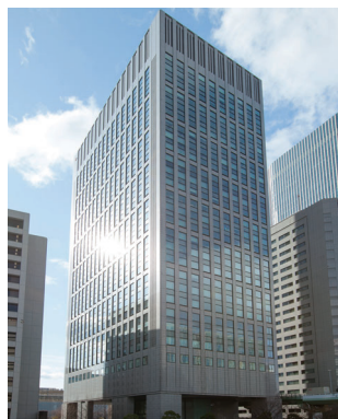
中之島セントラルタワー 大阪府大阪市北区